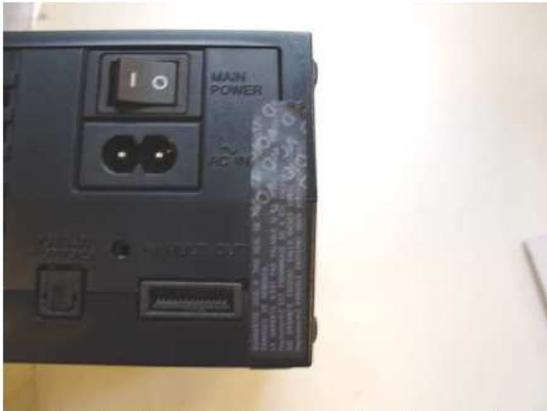
Poškodená plomba – na plombe zostanú nápisy VOID