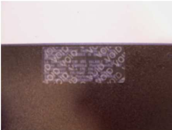
Poškodená plomba – na plombe zostanú nápisy VOID