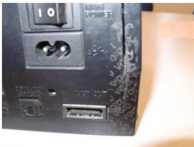
Odstránená plomba – na prístroji zostali viditeľné nápisy VOID